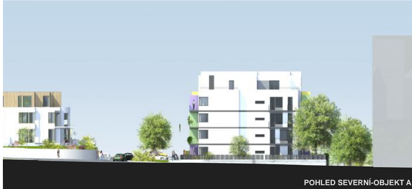
POHLED SEVERNÍ-OBJEKT A