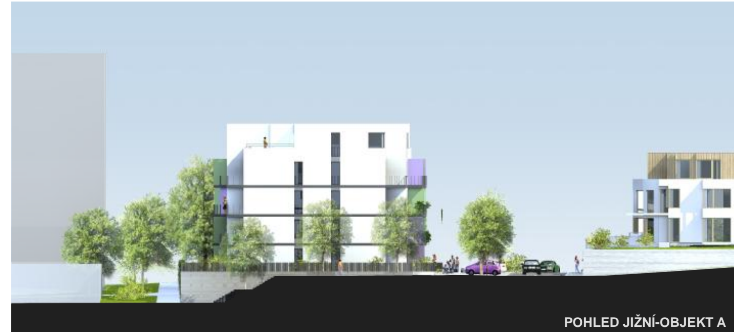
POHLED JIŽNÍ-OBJEKT A