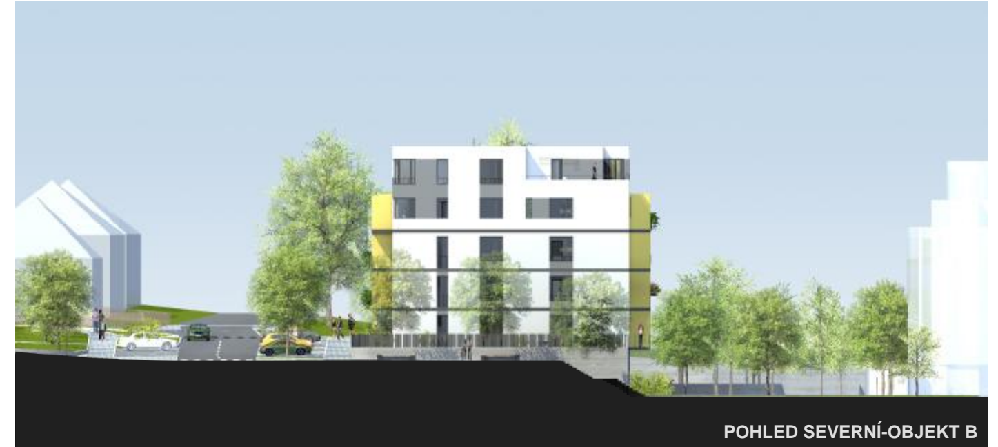
POHLED SEVERNÍ-OBJEKT B