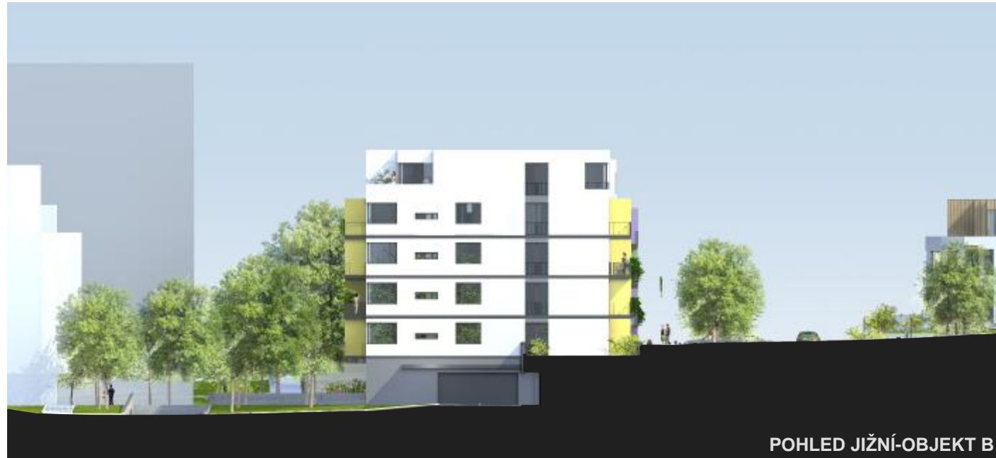
POHLED JIŽNÍ-OBJEKT B