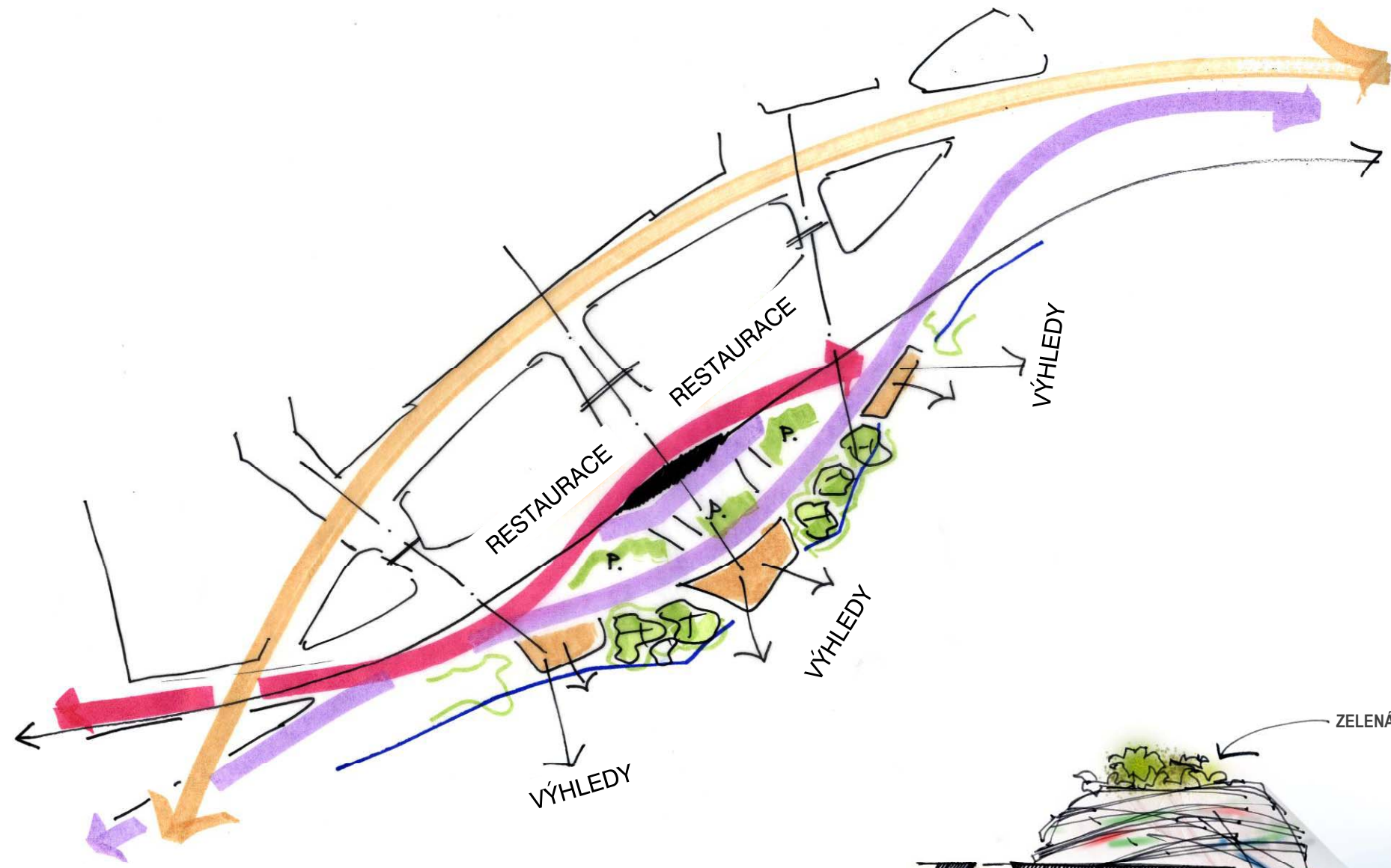
/ Princip cirkulace přes hlavní veřejný prostor