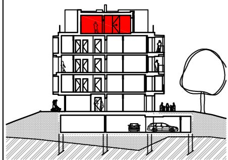
ORIENTAČNÍ SCHÉMA ETAPY I / PHASE I SCHEME