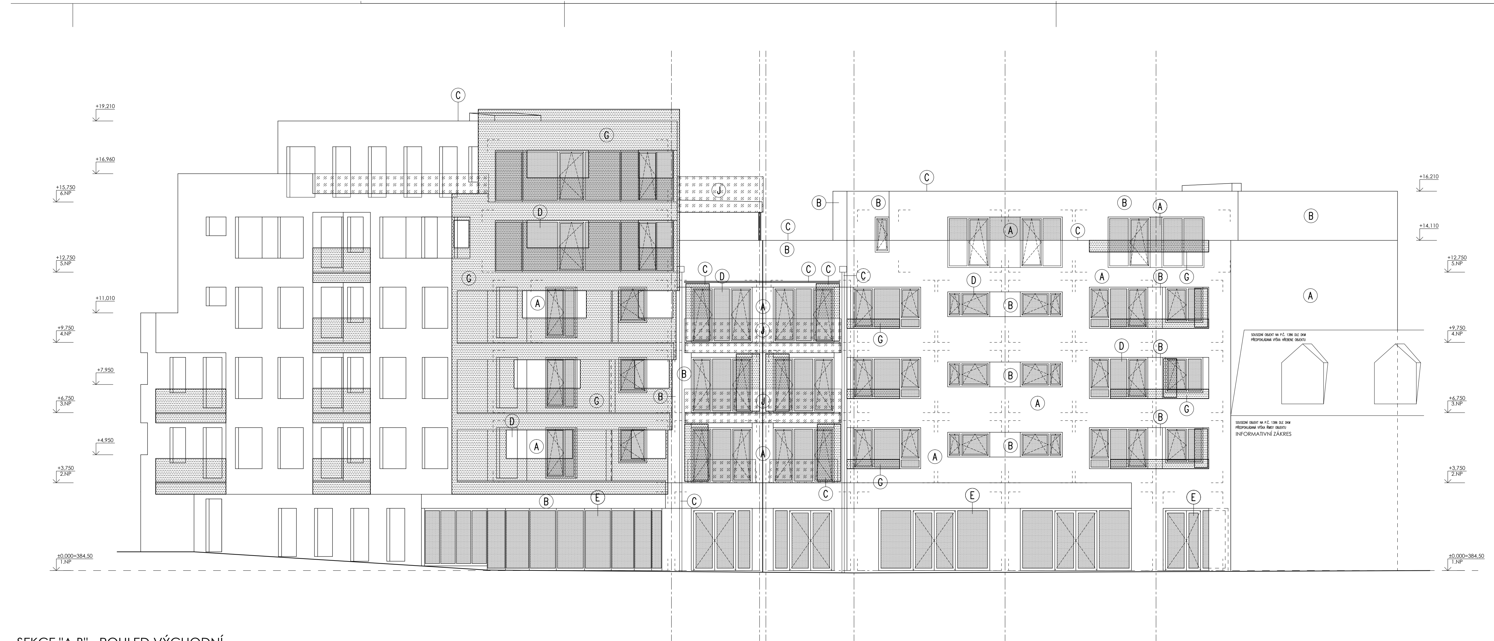
SEKCE "A,B" - POHLED VÝCHODNÍ